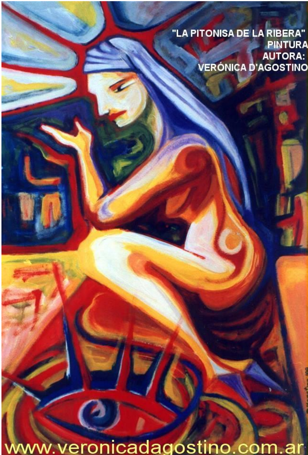
"LA PITONISA DE LA RIBERA" PINTURA AUTORA: VERÓNICA D'AGOSTINO

(Chacareras Salchicheras Dachshund, la música oficial del Salchi Pensador)